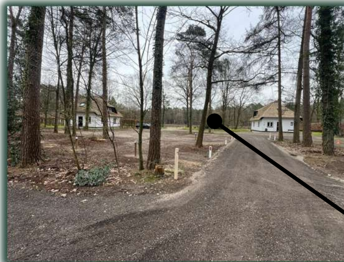
Zicht op heideveld

Een Recreatiewoning is te koop vanaf € 145.000,-